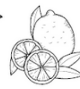
SCORZE DI LIMONE