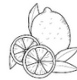
SCORZE DI LIMONE