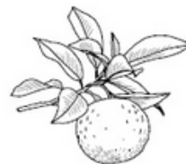
SCORZE DI ARANCIA