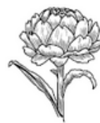
CARCIOFO VIOLETTO DI SANT'ERASMO